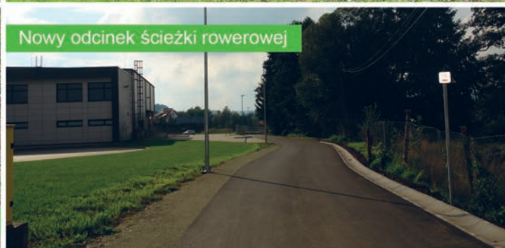
Nowy odcinek ścieżki rowerowej