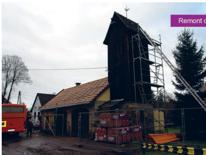
Remont dachu remizy w Słonem