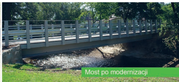
Most po modernizacji