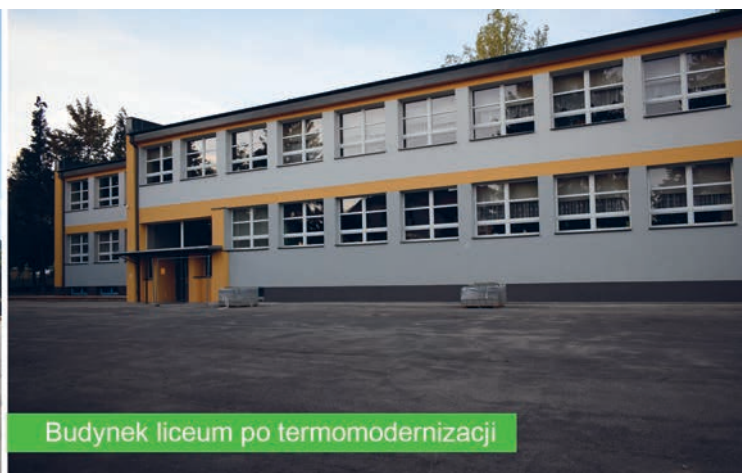
Budynek liceum po termomodernizacji