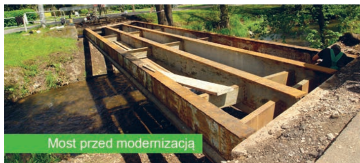
Most przed modernizacją