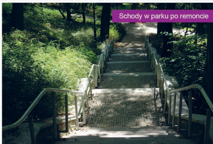
Schody w parku po remoncie