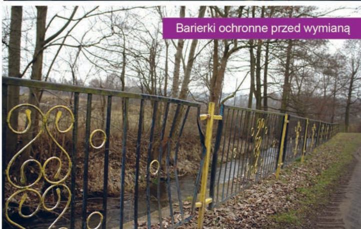
Barierki ochronne przed wymianą