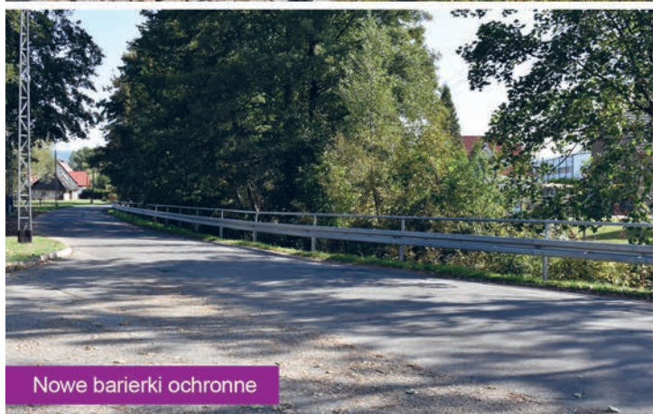
Nowe barierki ochronne