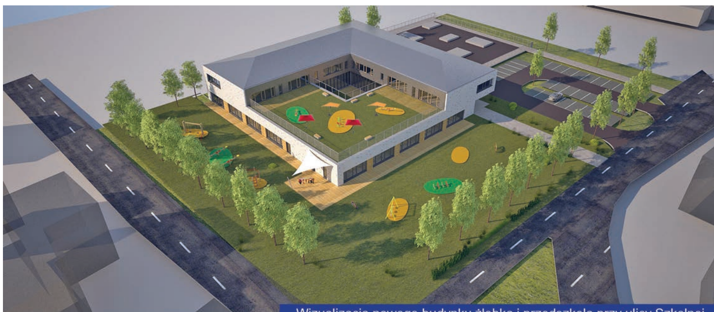
Wizualizacja nowego budynku żłobka i przedszkola przy ulicy Szkolnej

ZAKRES ZADANIA: budowa budynku pasywnego na planie kwadratu z dachem zielonym zlokalizowanym na terenie pomiędzy budynkiem Liceum Ogólnokształcącego a Zespołem Szkół Publicznych im. Jana Pawła II w Kudowie-Zdroju przy ul. Szkolnej. W procesie projektowania uwzględniono stworzenie prostego i czytelnego układu funkcjonalnego, w powiązaniu z istniejącą infrastrukturą oraz orientacją na optymalne oświetlenie światłem naturalnym. W budynku przewiduje się pomieszczenia zapewniające kompleksową obsługę żłobka i przedszkola (m. in.: z kuchnią, salą gimnastyczno-widowiskową, wózkownią). Zaprojektowany budynek dostosowany jest do użytku przez osoby niepełnosprawne. W obrębie inwestycji przewiduje się elementy małej architektury, w tym trzy place zabaw (jeden zadaszony) dostosowane do wieku użytkowników.