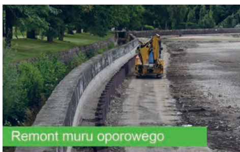
Remont muru oporowego