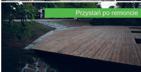
Przystań po remoncie