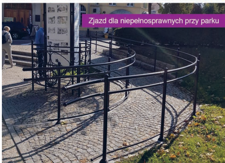
Zjazd dla niepełnosprawnych przy parku