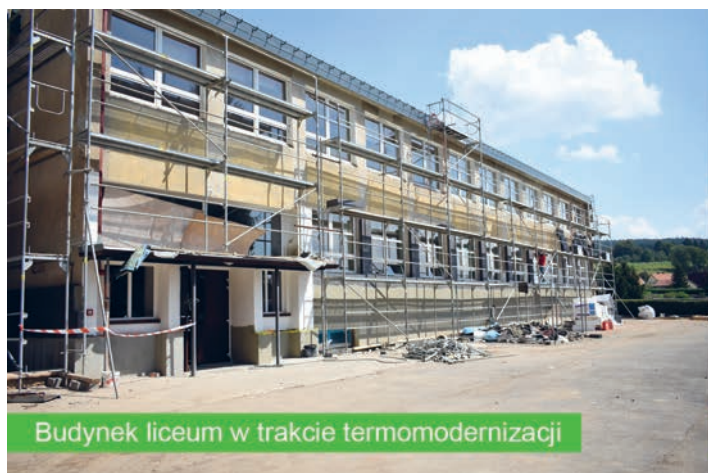
Budynek liceum w trakcie termomodernizacji