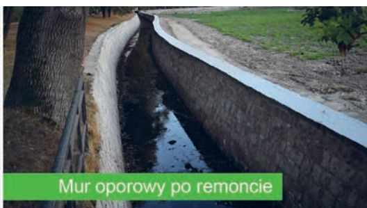
Mur oporowy po remoncie