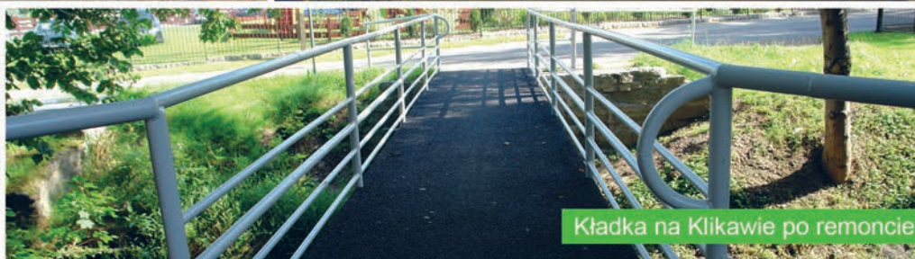
Kładka na Klikawie po remoncie