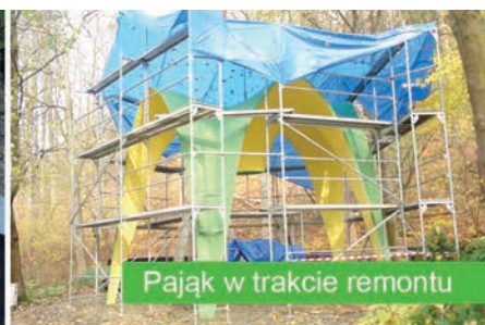
Pająk w trakcie remontu