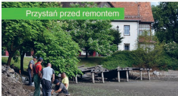
Przystań przed remontem