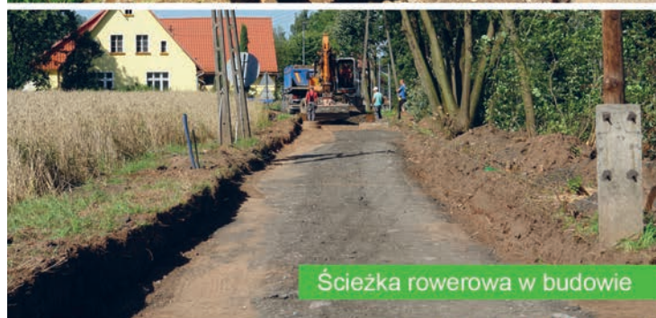
Ścieżka rowerowa w budowie